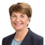
Consigliera federale Viola Amherd (PPD) Chefin VBS