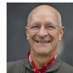
P' Claude Nicollier Astronauta dell'ESA ex Pilota militare