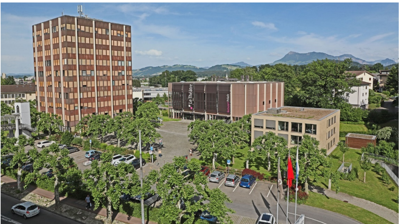
Gemeindefhaus (sinistra) e Le Théâtre (al centro)

Le Théâtre dispone di 120 parcheggi pubblici di fronte all'ingresso. Altre possibilità di parcheggio sono l'autosilo al lato opposto della strada oppure diversi parcheggi nella zona adiacente.